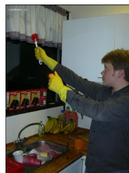
Mummi í eldhúsinu

Bakpoki Dagpoki* Svefnpoki Einangrunardýna Koddi* Vasaljós Áttaviti Lestrarefni Spil [Lyf sem viðkomandi þarf - ath. láta foringja vita]